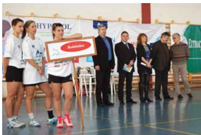
Előtérben Budakalász csapata

Az esten a fegyelmezett sport játék után a kupa szellemével összhangban a kötetlen beszélgetéseké volt a főszerep.