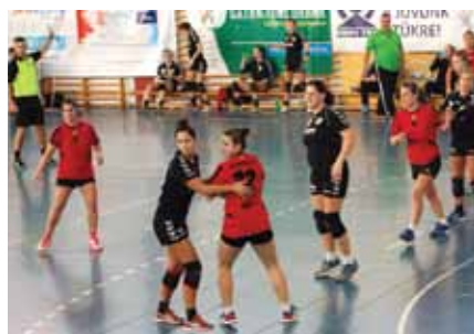
Piros mezben hazai pályán a budakalászi csapat

Budakalász volt a házigazdája a tizenkettedik alkalommal megrendezett Kárpát Meditop Kupa Női Kézilabda Tornának. A város életében a sport meghatározó jelentőségű. A torna fővédnöke Orbán Viktor miniszterelnök volt. A Kupa társszervezője az idén húsz éves születésnapját ünneplő Budakalászi Sport Club. A lányok számára ez a torna már felkészülés a február 22-én induló NBII-s bajnokságra. Budakalász Város Önkormányzata a két küzdelmes napot egy bankettel tette oldottabbá, amit a Kós Károly Művelődési Házban tartottak.