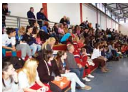
Óriási érdeklődés kísérte a tornát