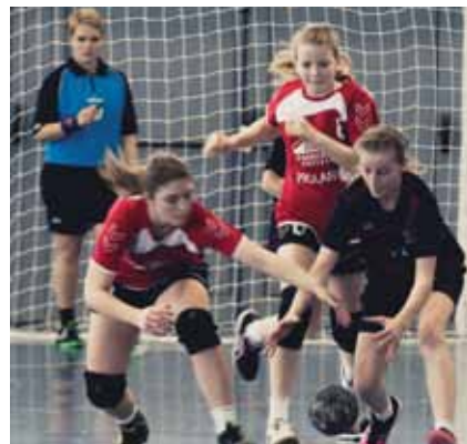
Izgalmas mérkőzések zajlottak

Zsinórban harmadszor diadalmaskodott a XII. Kárpát Meditop Kupa Női Kézilabda Tornán a Szekszárdi Fekete Gólyák KC NB I/B-s csapata.