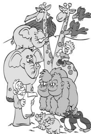
Képzéljétek, végre valahára megkaptuk a MindenHatóságtól a használatbavételi engedélyt...