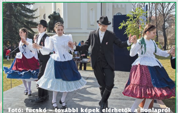
további képek elérhetők a honlapról