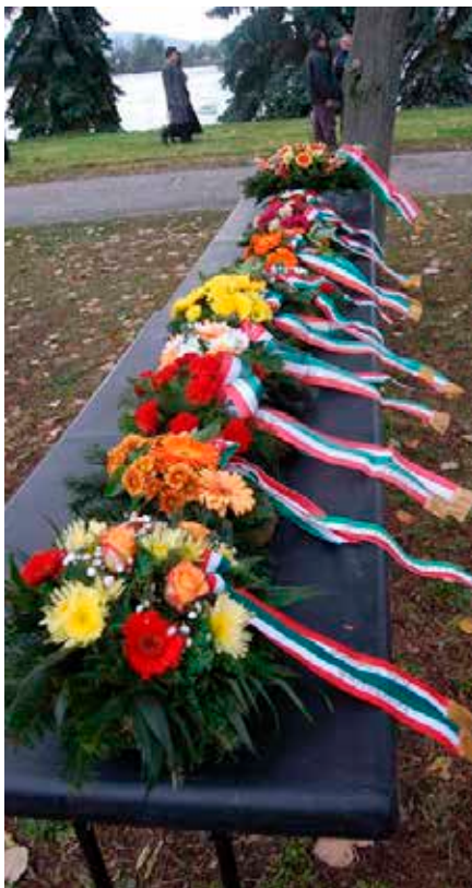
A megemlékezés koszorúi