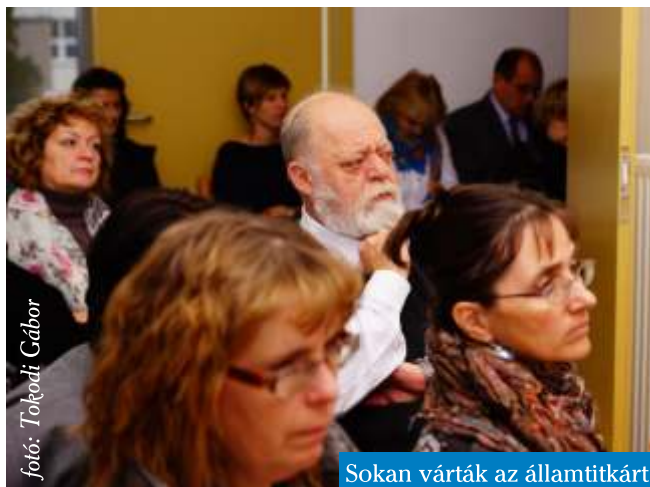
Sokan várták az államtitkárt