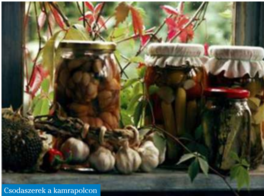
Csodaszerek a kamrapolcon

Az ám, a méhek. Dédnagyapád méheséből is kerültek orvosságok a kamrapolcra. A méz kincs és nincs nála finomabb ízű orvosság! Jó az sebre,