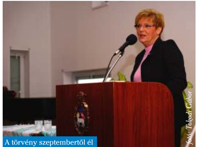
A törvény szeptembertől él

Elég sokszor kritizálták a bírálóink ezt a törvényt – személy szerint engem is – azzal, hogy ez egy konzervatív, múltba néző tör-