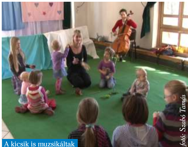
A kicsik is muzsikáltak