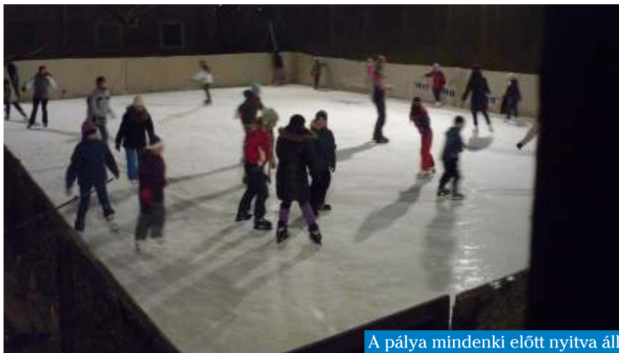
A pálya mindenki előtt nyitva áll

További információ: a 30-305-7305-as telefonszámon, valamint honlapunkon: