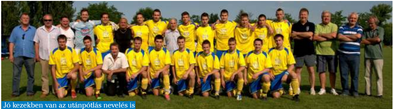
Jó kezekben van az utánpótlás nevelés is

A Budakalászi Munkás Sport Egyesületnek közel kétszáz sportolója van. Két szakosztálya a kézilabda, és a labdarúgás eredményesen működik. Többnyire kalászi srácokból álló csapataink megfelelő szakemberek irányításával készülnek a különböző korosztályos bajnokságokra. Minden helyi, és közeli településen lakó gyereket szívesen lát a klub.