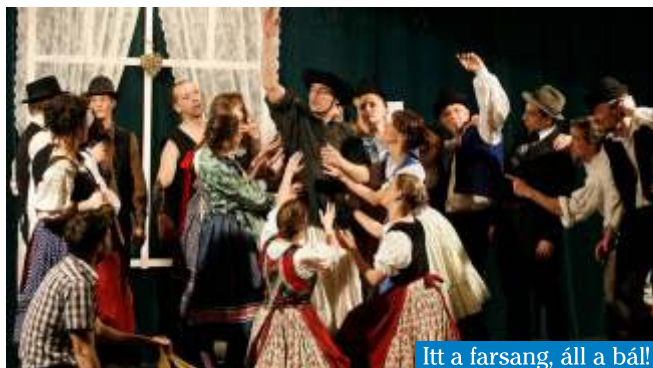
Itt a farsang, áll a bál!

Ha megkérdezzük valakit, hogy mi a farsang, azt válaszolja, hogy népszokás. Ezt válaszolja, és nem is válaszolhatna jobban erre a kérdésre. Népszokásaink szerves részei a magyar kultúrának. Dicséretes dolog tehát, ha van valaki, aki életben tartja ezeket a hagyományokat. Ilyen a Lenvirág Alapítvány is.