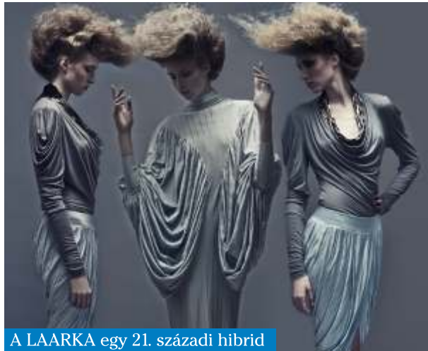
A LAARKA egy 21. századi hibrid

Nagyon meg kellett érlelned magadban, hogy mi az a téma, amivel te egy éven keresztül szeretnél foglalkozni. Én az egyetem alatt végig kerestem önmagam. Ki vagyok, mi vagyok, miért vagyok itt? Miért ezt akarom csinálni? Akkor 2009-ben én azt éreztem, itt Magyarországon, a levegőben, és ez