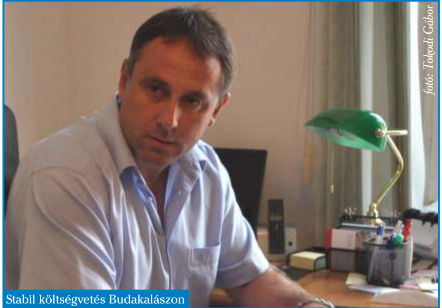
Stabil költségvetés Budakalászon

Megint egy fájó ponthoz érkezett a város. Szeretnénk megelőzni mindenféle pletykákat és mendemondákat ezzel kapcsolatban. Az új törvény alapján változnak az intézmények tulajdonosi viszonyai. Budakalászon ez érinti a két általános iskolát és a zeneiskolát is. A tervek szerint az várható, hogy az állam átveszi az általános iskolai oktatás működtetését, és ezzel együtt magához vonja az okta-