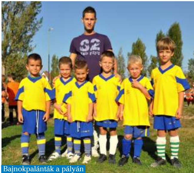
Bajnokpalánták a pályán

A Budakalászi Munkás Sport Egyesületnek közel kétszáz sportolója van. Két szakosztálya a kézilabda, és a labdarúgás eredményesen működik. Többnyire kalászi srácokból álló csapataink megfelelő szakemberek irányításával készülnek a különböző korosztályos bajnokságokra. Minden helyi, és közeli településen lakó gyereket szívesen lát a klub.