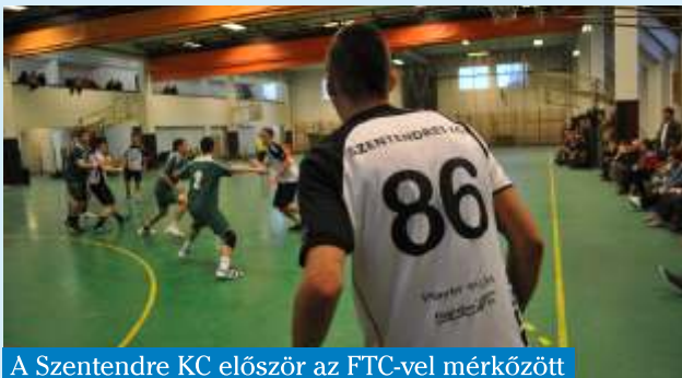
A Szentendre KC először az FTC-vel mérkőzött