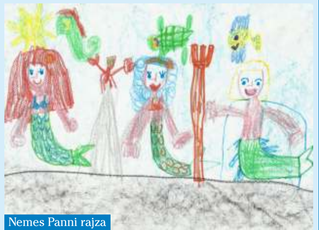
Nemes Panni rajza