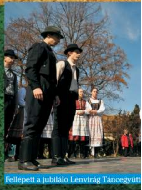
Fellépett a jubiláló Lenvirág Táncegyütt