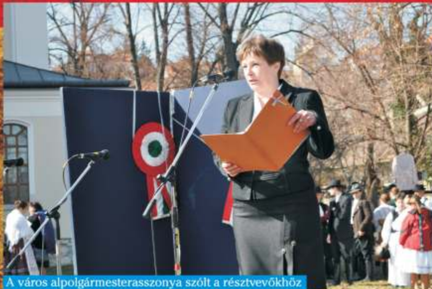
A város alpolgármesterasszonya szolt a résztvevőkhöz

Katonák mennek a télből a tavaszba, Velük a Szabadság véres istene. Szólnok, Isaszeg, nagysallói zászlók Szállnak a szélben és büszkén lengenek.