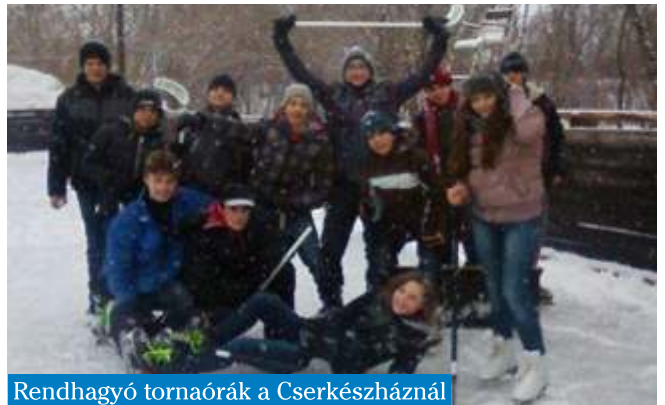
Rendhagyó tornaórák a Cserkészháznál

Reméljük, hogy jövőre is korizhatunk biztonságos körülmények között! Köszönettel: a Telepi Suli tanulói és tanárai