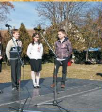
Szentistvántelepi Általános Iskola diákjai