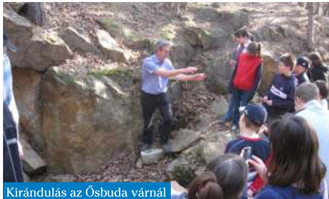
Kirándulás az Ősbuda váránál

Köszönjük szépen a lehetőséget, ha megnövnünk, megháláljuk. Talán pár év múlva részt vehetünk a feltárásban, vagy támogatjuk a kutatást.