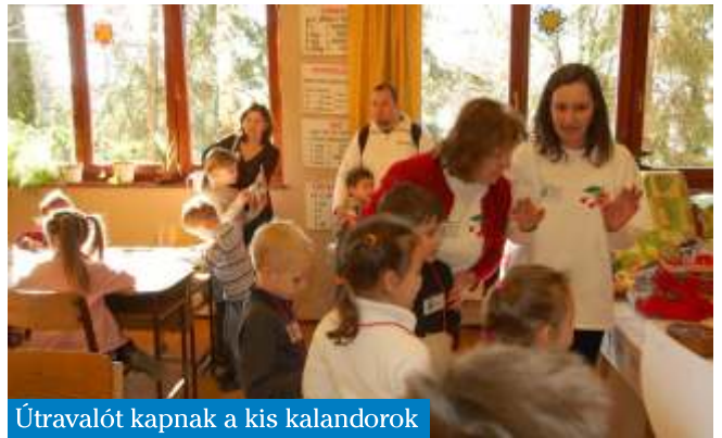
Útravalót kapnak a kis kalandorok

2012. március 3-án, szombaton 9:00 órától egy meglepetés programmal készültünk a leendő elsősöknek és szüleiknek. A hozzánk látogató óvodásokat különböző állomásokon különféle feladatokkal vártuk. A célunk az volt, hogy játékos formában, minél többet megmutathassunk az iskolai életből. Nagy örömeinkre sokan vettek részt ezen a programon.