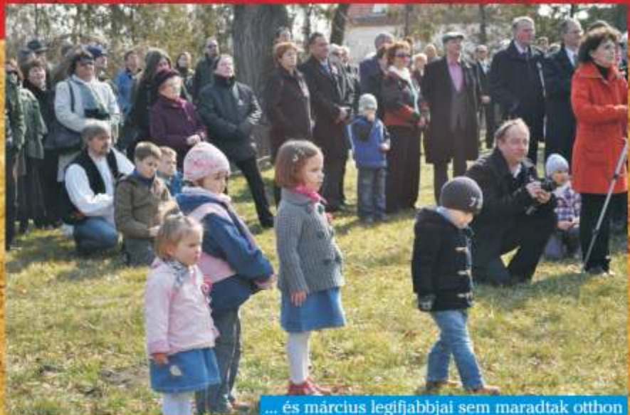
... és március legifjabbjai sem maradtak otthon