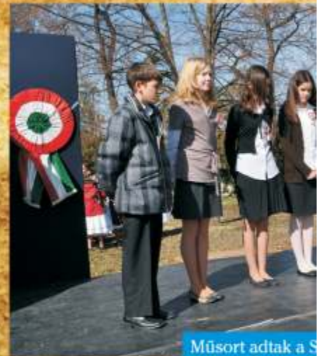
Műsort adtak a S