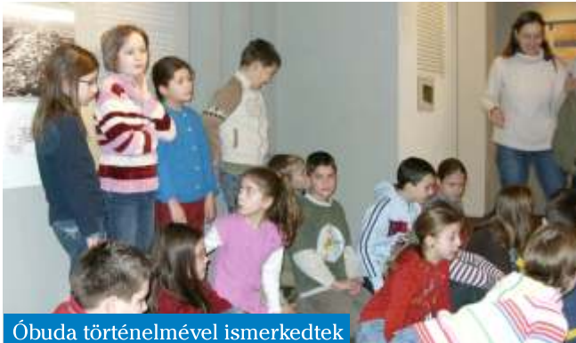
Óbuda történelmével ismerkedtek

Az Óbudai Múzeum és Könyvtár a TÁMOP 3.2.11 számú Nevelési-oktatási intézmény tanórai, tanórán kívüli és szabadidős tevékenységeinek támogatása című felhívására pályázatot nyújtott be, melyet meg is nyert. Ez tette lehetővé, hogy iskolánk 4. évfolyama egy témahéten vehetett részt a Múzeumban. A Múzeum állandó kiállításán keresztül megismerkedhettek a diákok Óbudával, népünk kulturális örökségeivel, nemzeti kultúránk nagy múltú értékeivel.