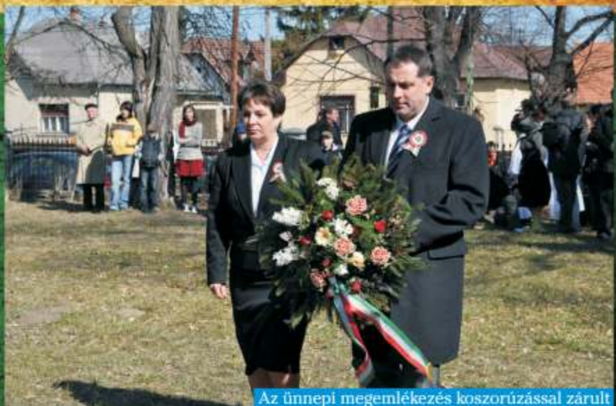
Az ünnepi megemlékezés koszorúzással zárult