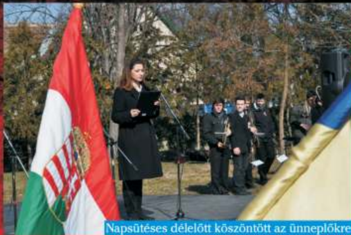
Napsütéses délelőtt köszöntött az ünneplőkre