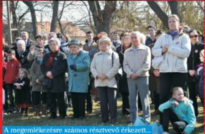
A megemlékezésre számos résztvevő érkezett...

Emlékfolyónkon hős seregek úsznak, Huszárok, kiknek méltó párja nincs. Dobok peregnék és honvédok jönnek, A győztesek közt győztes Damjanich!