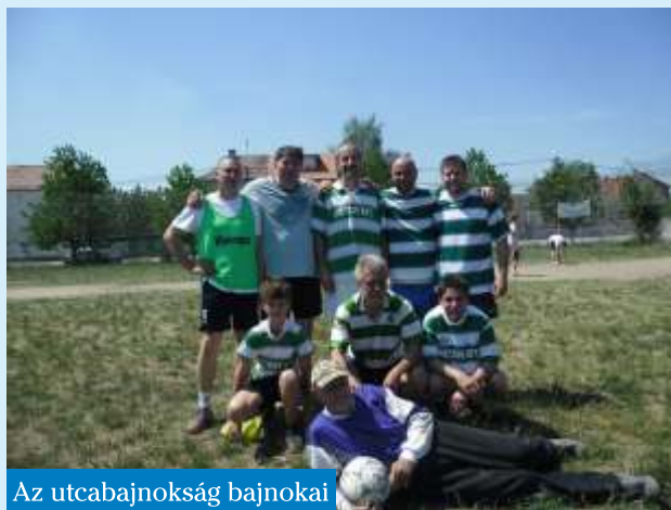
Az utcabajnokság bajnokai