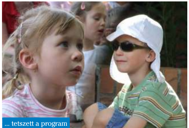
... tetszett a program