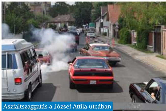
Aszfaltszagatás a József Attila utcában

Égtek a gumik az aszfalton, az első budakalászi amerikai autós találkozón. Sokan nézték végig, ahogy a város utcáin felvonultak a különleges és veterán járművek. A faluház udvarán kiállított ritkaságokra is sokan voltak kíváncsiak. A főszervező maga is gyűjti ezeket az autókat