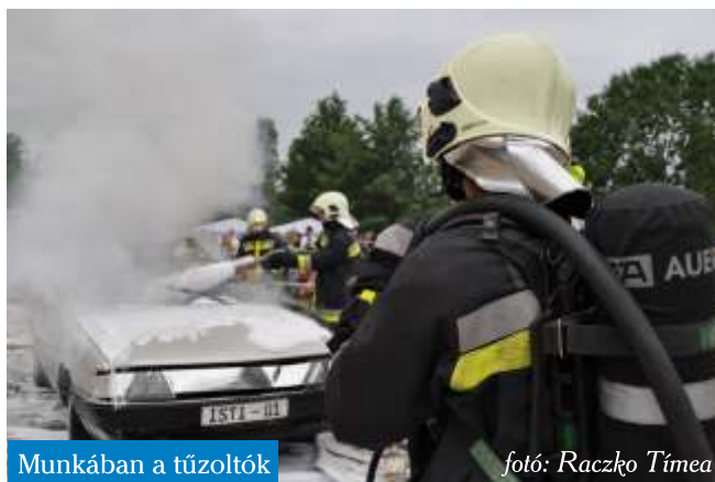
Munkában a tűzoltók