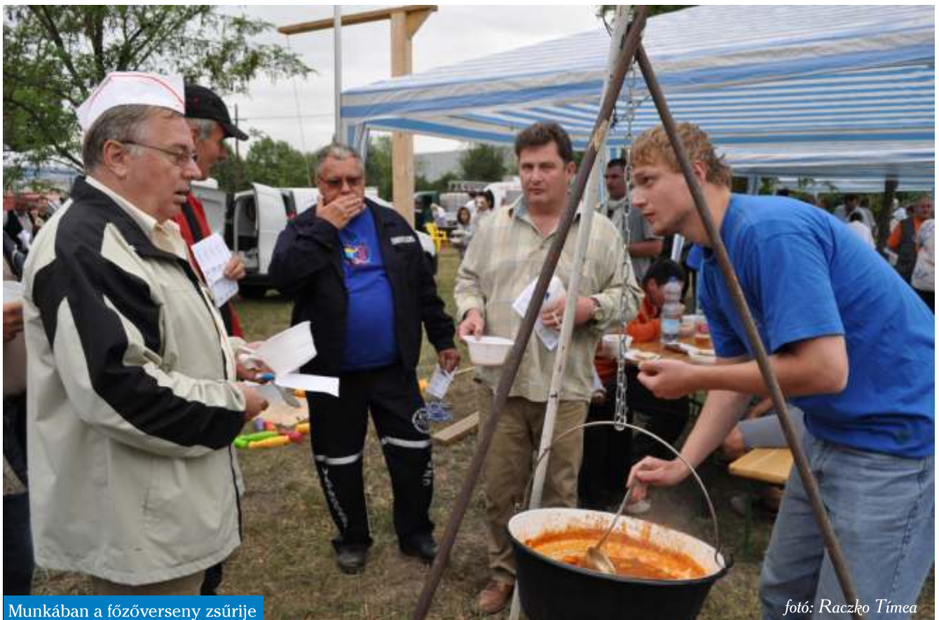
Munkában a főzőverseny zsűrije

Délután a Juniális egyik leglátványosabb programját, Budakalász Védőinek bemutatóit tekinthették meg a résztvevők. A Budakalászi Önkéntes Tűzoltók, a Pomázi Tűzoltók, valamint az Országos Mentőszolgálat munkatársai köz-