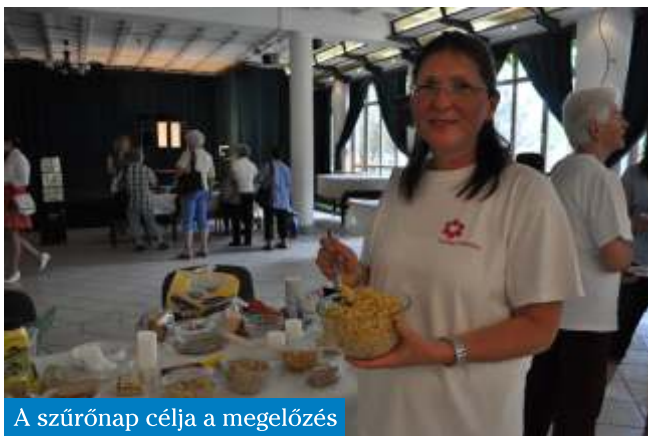
A szűrőnap célja a megelőzés