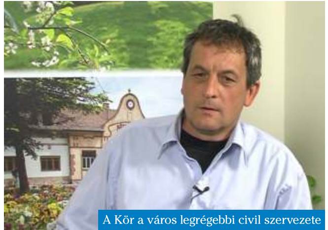
A Kör a város legrégebbi civil szervezete

A szüreti felvonulás idén a 26. lesz. 1986 februárjában alakult a Baráti Kör, akkor már rendeztünk Majálist illetve Szü-