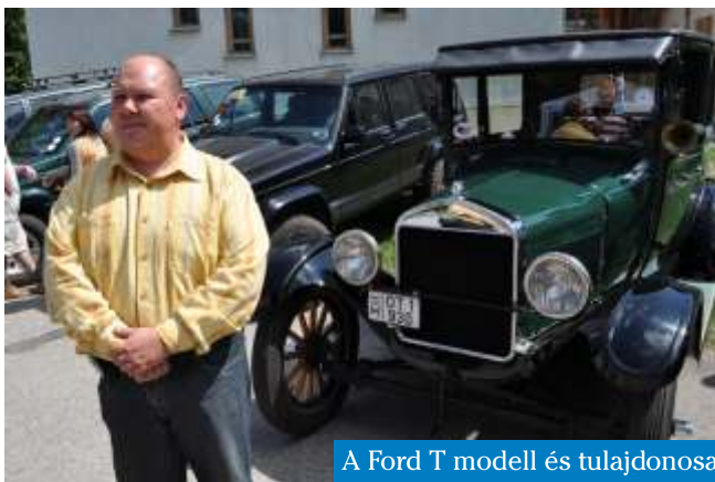
A Ford T modell és tulajdonosa

A rendezvény során az összes autó végigvonult Budakalász utcáin a lakók és nézelődők legnagyobb örömeire. Egy igazi kuriózum is érkezett, hiszen egy eredeti FORD T-modellt is elhozott a gazdája.