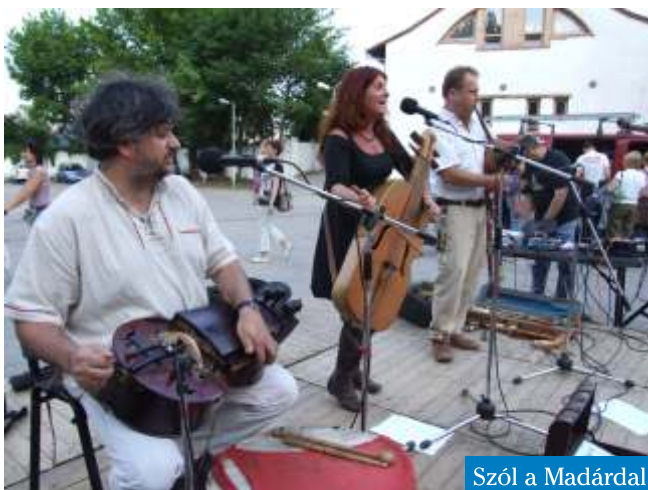
Szól a Madárdal

A Családsegítő és Gyermekjóléti Szolgálat munkatársai ügyességi és társasjátékokkal várták a hozzájuk érkező kicsiket és nagyokat.