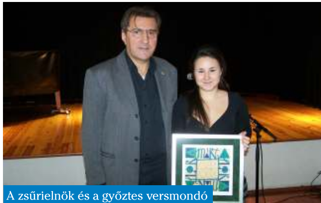
A zsűrielnök és a győztes versmondó

A budapesti és a környékbeli városokból, községekből