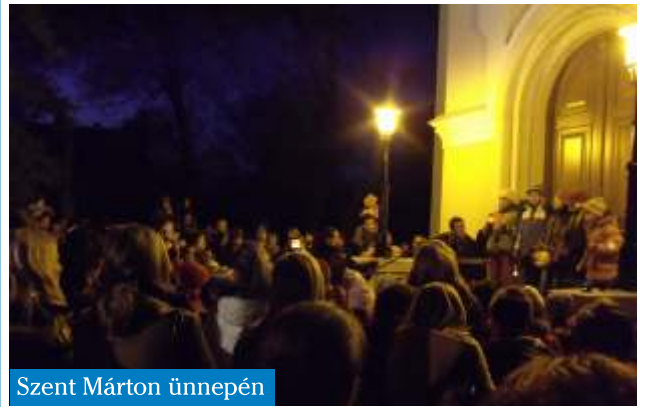
Szent Márton ünnepén

Iskolánkban már többéves hagyomány, hogy november 11-én, Márton-napon lampionos felvonulást tartunk. A múlt héten minden németet tanuló kisdiák elkészítette lampionját és dalokat tanult Szent Mártonról. Pénteken késő délután gyülekeztünk az iskolaudvaron. Miután a Szalonka Óvoda németes csoportja is megérkezett, meggyújtottuk a lampionokat és elindultunk a katolikus templom kertjébe. Itt először a 4. osztályosok énekét hallgattuk meg, mely Szent Márton életéről szólt. Utána a Mártonról szóló leghíresebb legendát, a köpenyosztás történetét játszották el a harmadikosok. Játékkal folytattuk a programot: a legkisebbek elrejtett képek után kutattak az addigra már koromsötét templomkertben, a nagyobbak pedig tudásukról adhattak számot egy kérdéssor megválaszolásával. Mindkettő jutalma édesség volt. Ezután az iskolába visszatérve a szülők által beküldött sok-sok finom süteményből falatoztunk és bizony a forró tea is jólesett! Találkozunk jövőre is! Gyay Anikó német tanító