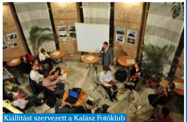
Kiállítást szervezett a Kalász Fotóklub