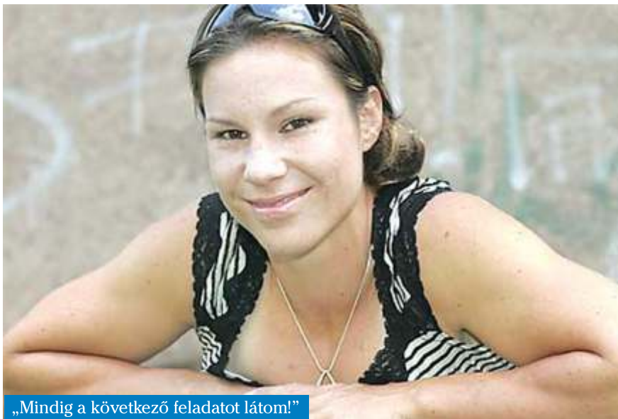
„Mindig a következő feladatot látom!”

Mindegyik arany, ezüst és bronzérem mögött van egy történet, és persze nagyon sok munka. A felkészülés tényleg minden alkalommal olyan, hogy sokszor csak pár centin múlnak az eredmények. Egy első és egy második helyezés mögött közel ugyanannyi munka van! Amire talán mégis a leg-