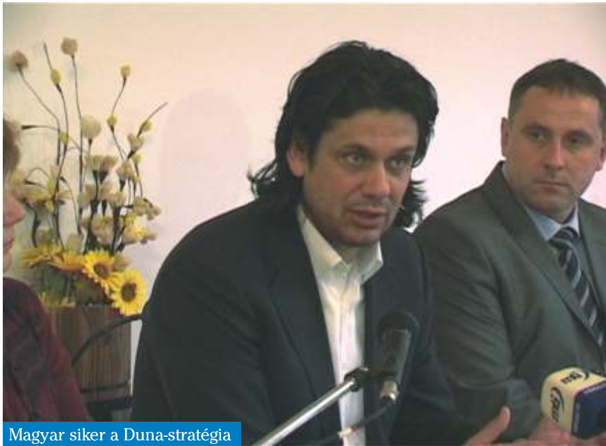
Magyar siker a Duna-stratégia

A szentendrei Duna ág szerepéről és jelentőségéről tárgyaltak a résztvevők a novemberben megrendezett Duna konferencián, Budakalászon.