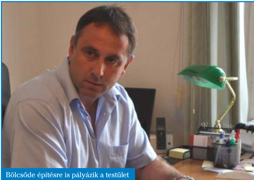
Bölcsőde építésre is pályázik a testület

Január 9-e a pályázat beadási határideje, addig nekünk rendelkezniünk kell engedélyes tervekkel a bölcsődére. Az épület nagy része a volt gáz-cseretelep lenne felépítve, kicsit belenyúlna a Telepi Óvoda jelenlegi udvarába is. A képviselőtestület elhatározta, hogy tovább megyünk az úton, és megrendeljük a tervdokumentáció második ütemét, ami már engedélyes terveket fog tartalmazni. Ez egy hatszáz négyzetméteres intézmény, melynek