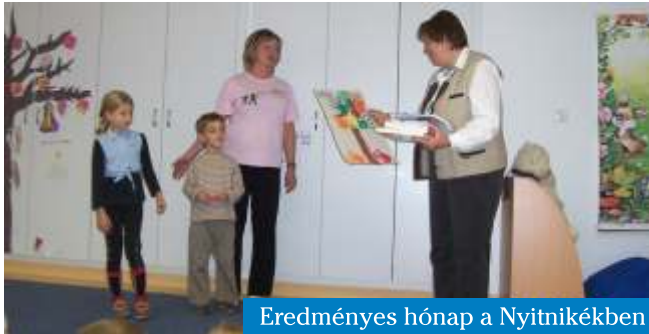
Eredményes hónap a Nyitnikékben

A Nyitnikék óvoda dolgozói, és a rájuk bízott gyermekek mozgalmassal november tudhatnak a hátuk mögött: