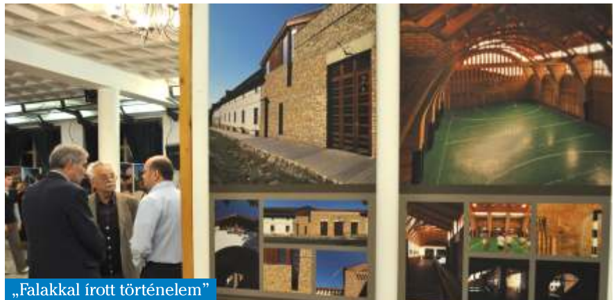
„Falakkal írott történelem”