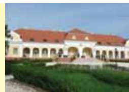
III. Pál által építtetett pomázi kastély

III. Pál részt vett az evangélikusok jogait igénylő szervezkedésekben. Így 1773. október 11-én egy küldöttség tagjaként Bécsben Mária Terézia királynő elé terjesztette az evangélikusok bugyi konferen-