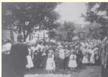
A Wattay család és a „kiskastély” Pomázon