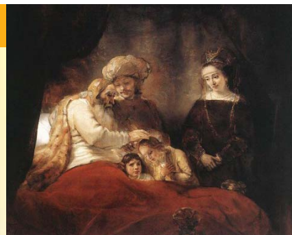
Rembrandt: Jákob megáldja József fiait

A kislány álláig húzta a paplant s azzal az őszinte kíváncsisággal kérdezte nagyapját, amivel mindig le tudta venni a lábáról. „Nagyapapa, hogyan talál rám majd a lovag, aki a férjem lesz?” Nagyapapa, akit váratlanul ért a kérdés, egy pillanatig tűnődött, majd komolyan így szólt: „Látod kicsim, ezt véletlenül épp tudom. Egy angyal mesélte nekem, így tehát kétségkívül igaz. A történet réges-régen kezdődött valahol Olaszországban, de mi csak sokkal később kapcsolódunk bele, amikor Guido bácsi még kisfiú volt és Argentínában élt egy marhabőr kereskedő mellett. Apja tette föl a hajóra Genovában, még a kilencszázhuszas évek végén, amikor nagy volt a szegénység. A kapitányra bízta a fiát, s meghagyta, kinek kell átadni majd érkezéskor Buenos Airesben. A marhabőr kereskedővel aztán Chilébe jártak a magas hegyekbe, s olesó árukat vittek a csordapásztoroknak, amiért értékes bőrt kaptak. Később Guido bácsit beíratták a rosarioi egyetemre, mert akkor már az apja is küldött pénzt, amiből tanulhatott. Hívta is haza, Olaszországba, mert be-