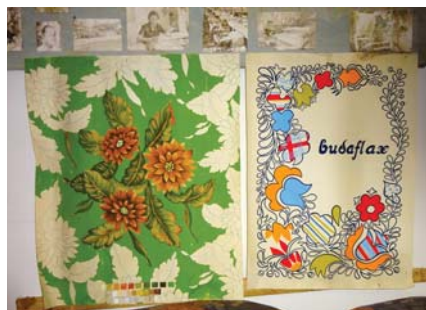
Minta-tervek 1970-es évek