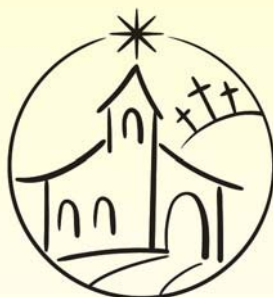
Grafika: Bajcsi-Juhász Veronika

tevő, aki kudarcos, halálra ítélt életnek utolsó pillanatában mégis így szólt: „ Jézus, emlékezzél meg rólam, amikor eljössz a te királyságodba! ” (Lukács evangéliuma 23,42) Bal kéz felől még egy kereszt, rajta egy másik bűnöző. Ő halálában is csak káromolta, gúnyolta a Messiást. Ő arról beszélt: Isten nem zsarnok, nem kényszeríti ránk az ajándékait sem: van lehetőség nélküle élni.