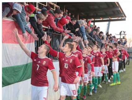
Márk a második a sorban

Kalászról szép gyermekkori emlékeket őrzök, 2010-ig éltünk itt. A budakalászi focicsapatban, a BMSE-ben kezdtem el