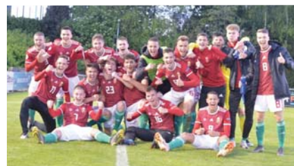
Márk: hátsó sor, balról a harmadik.

Csodás élmény volt már az Európa-bajnokság is, viszont a világbajnokság egészen elképesztő lesz: Brazíliában, ahol mindenki imádja a futballt! Nagyon nagy szó, hogy sikerült kijutnunk a világ legjobb csapatai közé, erre máris büszkék lehetünk, amikor megtudtuk, hogy kijutottunk, akkor voltam a legboldogabb, hiszen gyerekkorom óta ilyen eredményről álmodom. Remélem, a világbajnokságon is egyszerű sikereket érünk el!