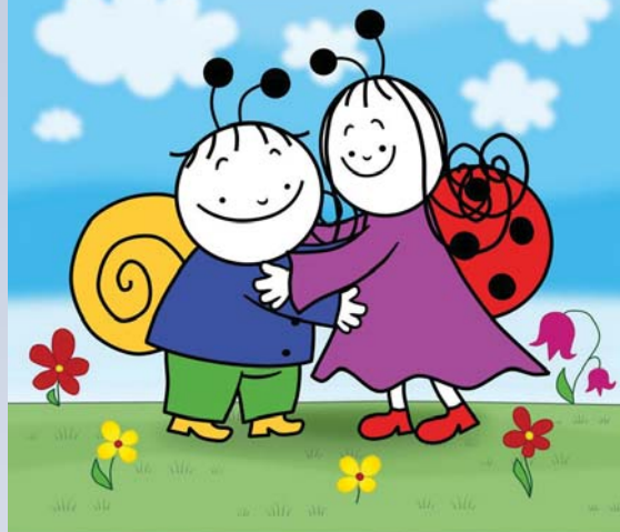
A Bogyó és Babóca című animációs film plakátja

1994-től 1998-ig a Pető intézetben is dolgoztam, ott a konduktori és tanítóképzésen vettem részt. Nekem a tanárság az első számú szakmám, miközben persze a második számút, tehát az alkotást is szívesen és elég intenzíven művelem.