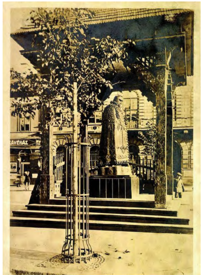
A „Kárpátok Óre” Kolozsvárt. Kolozsvári Szeszák Ferencz műve.

A Kárpátok óre más jelentéssel ugyan, de feléledt poraiból. Ma a Szalajka-völgyben, Szilvásváradon, Csíkcsomortán, Csókákön és Budakalászon áll másolata, amelyet városunkban a békediktátum 90. évfordulóján állítottatott az önkormányzat. A terveket Szcuka Attila készítette, alkotója pedig Horváth-Béres János. A kalászi, háromszáz éves, lábon elhalt kocsányos tölgyből faragott emlékművet stilizált madárszárny formájú tető védi. A talapzat kötőmbje a budakalászi mészkőbánya ajándéka. Érdekes, hogy a szobor előtti téren a Nagy-Magyarország térképe rajzolódik ki, pirossal jelölve Kolozsvárt és Budakalászt.