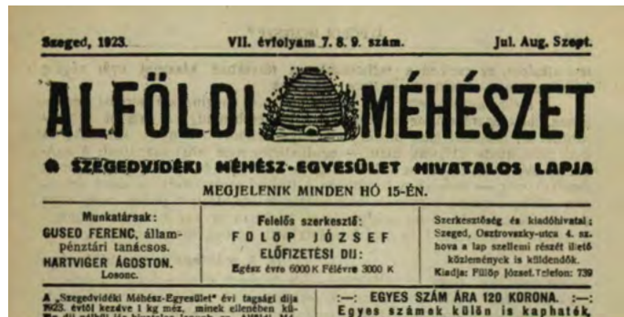
Az Alföldi Méhészet című újság 1923-ban megjelent száma, melyben hírt adtak a Méhésztársasjátékról.