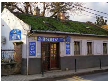
Az első fotópár lakhelyét és trafikját mutatja, ami ma ékszerész szaküzlet.