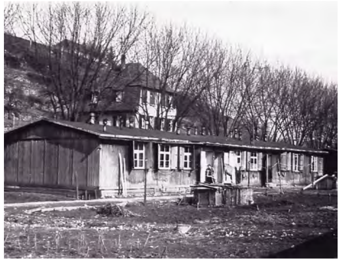
Kitelepítés után nagyon sok kalászi családot ilyen barakokban helyeztek el a németországi Backnangban.

„Nem volt szívderítő látványban részünk: zsákok, batyuk, ládák, kosarak, kis kályhák, alkalmi fekvőhelyek, síró gyerekek, sóhajtozó öregek és általános depresszió... Utolsó és megható jelent volt, amikor az itthon maradó és kitelepülő zenészekből összeállt egy fúvószenekar és eljátszották a magyar himnuszt. Ezután a zenészek egy része felszállt a vonatra, egy része itthon maradt, a vonat pedig elindult. Ezzel a momentummal Budakalászon befejeződött a svábok kitelepítése.”