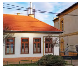
A következő képeken a Kalász Sulit (egykor Budakalászi Általános Iskola) és közvetlenül mellette az azóta lebontott Községi Tűzoltószertárt látjuk. Úgy tűnik, több ilyen szertár is volt a község területén. Az idősebbek úgy tudják, hogy a Budai út – Szentendrei út sarkán, most a Postával szembeni kisbolt épülete is tűzoltóraktár volt. Levéltári adatok szerint 1939-ben alakult meg a Budakalászi Önkéntes Tűzoltó Egyesület.

Nemrég a város weboldalán már írtunk az I. és II. világháború hőseinek emléket állító szoborról, amely a budakalászi Szent Kereszt Felmagasztalása templom kertjében látható. A szobrot készítő művész a veszteség feletti bánatában ágyúcsőre boruló emberalakot egy budakalászi illetőségű, háborús túlélőről mintázta. Az emlékmű talapzatán a háború budakalászi hőseinek és áldozatainak nevei olvashatók. Az emlékmű – mint a fotókon látható – eredetileg a templom előkertjében állt, innen került a templom mögötti térre.