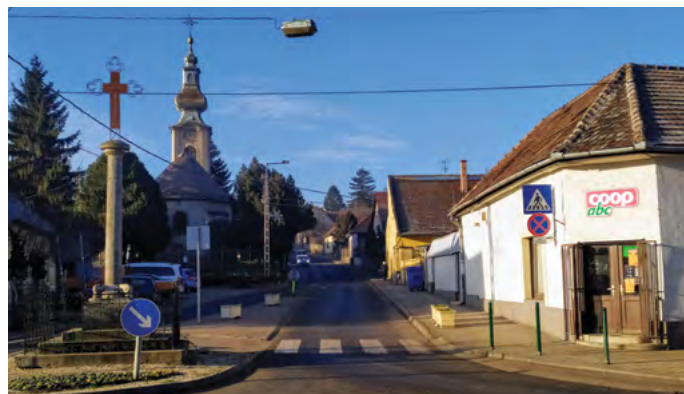
A Budai úton tovább haladva találjuk a Szerb keresztet és a sarkon ma már egy élelmiszerüzletet.