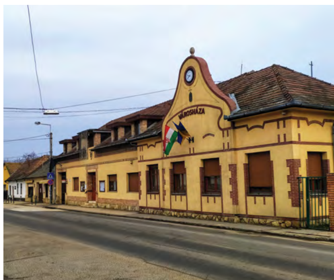
A pár lépéssel arrébb készült fotón az akkor még Községházának nevezett épület látható.