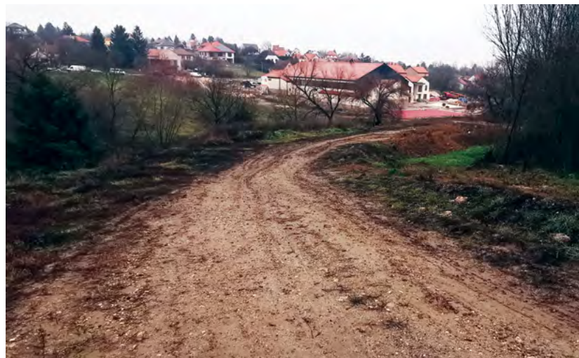
A megközelíthetőség javítása, az úthálózat fejlesztése nélkülözhetetlen, de ehhez nagyon sok pénzre van szükség.

A szükséges források megszerzéséért mindent megteszünk. A tavaly beadott pályázataink ugyan nem jártak sikerrel, de folyamatosan egyeztetünk a kormányzati szereplőkkel. A forrásszerzés érdekében kezdeményezett újabb tárgyalásokon biztató fejleményeket tapasztaltunk, reméljük eredménye is lesz.