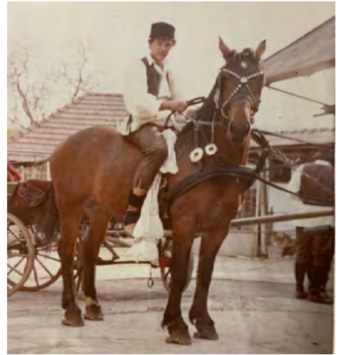
Szerb fiú húsvétkor (1979)

A szerbek hagyományosan ortodox vallásúak, ezért minden ünnepük más napra esik, mint a többségnek Magyarországon. Ennek az az oka, hogy ma a 16. században bevezetett Gergely-naptárt használjuk, a keleti keresztények azonban megtartották a Kr. u. 46-ban bevezetett julián naptárt, így két hét eltolódás van az állóünnep között. A mozgó ünnepek kiszámolása még nehezebb: míg a többség idén április 4-én ünnepelte a húsvétot, az ortodoxoknál idén április 30-ára esik nagypéntek, húsvétvasárnap pedig május 2-án lesz.