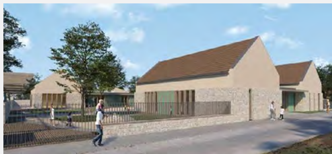
A Zacc Építésziroda pályázata

A versenyben a legtöbb szavazatot a Zacc Építésziroda Kft. pályázata kapta. A bírálók szerint a terv nagy értéke volt, hogy a templomkert és az óvoda kertjének kapcsolatát nagyon érzékenyen alakította és külön kiemelték a helyben szeretett és „otthon lévő” anyaghasználatot. A második helyezést az Építész Stúdió Kft. pályamunkája kapta.