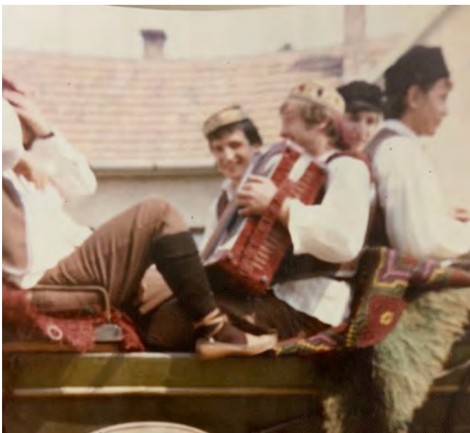
Budakalászi és pomázi szerb fiúk locsolkodása 1979-ben