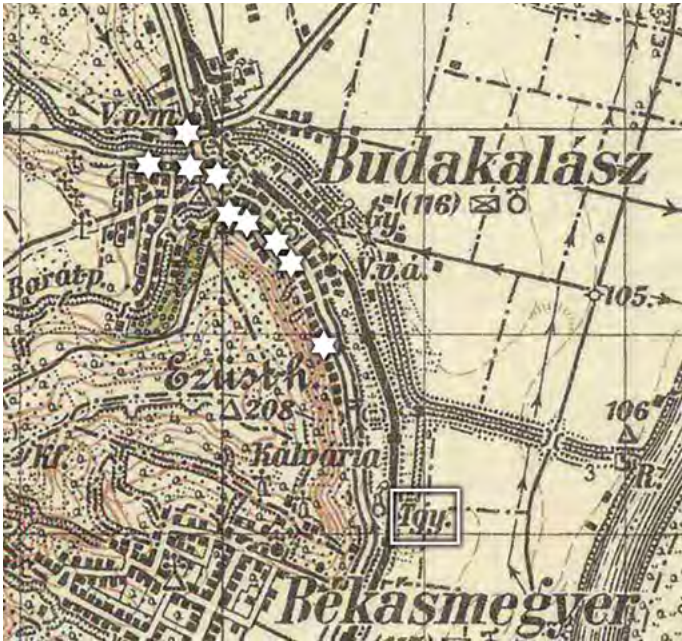
Budakalász és Békásmegyér 1941-es térképe