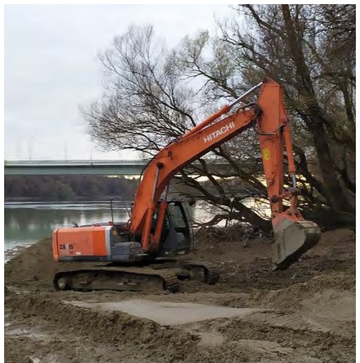
Beavatkozás a Natura 2000 területen

A hajótárolóktól vezető rövid vontatási útvonalak keresztezik a vegyes használatú Duna sétányt és nemzetközi kerékpárutat, ami szintén veszélyforrás. A partszakasz egyes részeinek vegetációja mind struktúrájában, mind természeti állapotában romlik, ezért annak ellenére, hogy nem tulajdonosa vagy kezelője a területnek, a budakalászi városvezetés lépéseket tesz a további káros folyamatok megakadályozása és a természeti értékek megőrzése érdekében.