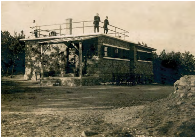
Kőhegy – 1937.

A kőhegyi menedékház, mint a régi menedékházak általában, a 19. század végén induló, 20. század első évtizedeiben nagy népszerűségnek örvendő magyar turista mozgalom öröksége. A Visegrádi-hegység Pomáz és Szentendre között fekvő, 367 méter magas Kő-hegy lapos fennsíkján épült menedékház története a Magyar Turista Egyesület Szentendrei Osztályának megalakulásáig, 1920-ig nyúlik vissza. Ekkor hozták ugyanis létre a kirándulni kedvelő szentendreiek a turista egyesületet. Az alapító tagok között volt földbirtokos, rendőrfelügyelő, tanár, posta-távtiszt, műszerész, több hivatalnok és diák. Tiszteletbeli