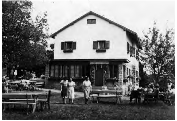
Menedékház – 1940.