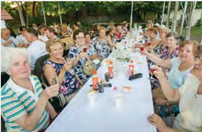
Az egészségklub tagjai

Minden évben július 1-én ünnepeljük – Semmelweis Ignác születésének évfordulóján – a Semmelweis-napot: a magyar egészségügy napját, az egészségügyi és szociális dolgozókat. Tegnap, június 30-án, adták át a Faluházban Semmelweis-nap alkalmából a „Budakalászi Polgárok Egészségéért” Díjat. Köszönetet mondtak az egészségügyi és szociális pályán nyugdíjba vonulóknak és jubilálóknak valamint külön köszönet járt a járványügyi helyzetben helytállóknak és oltási programban résztvevőknek.