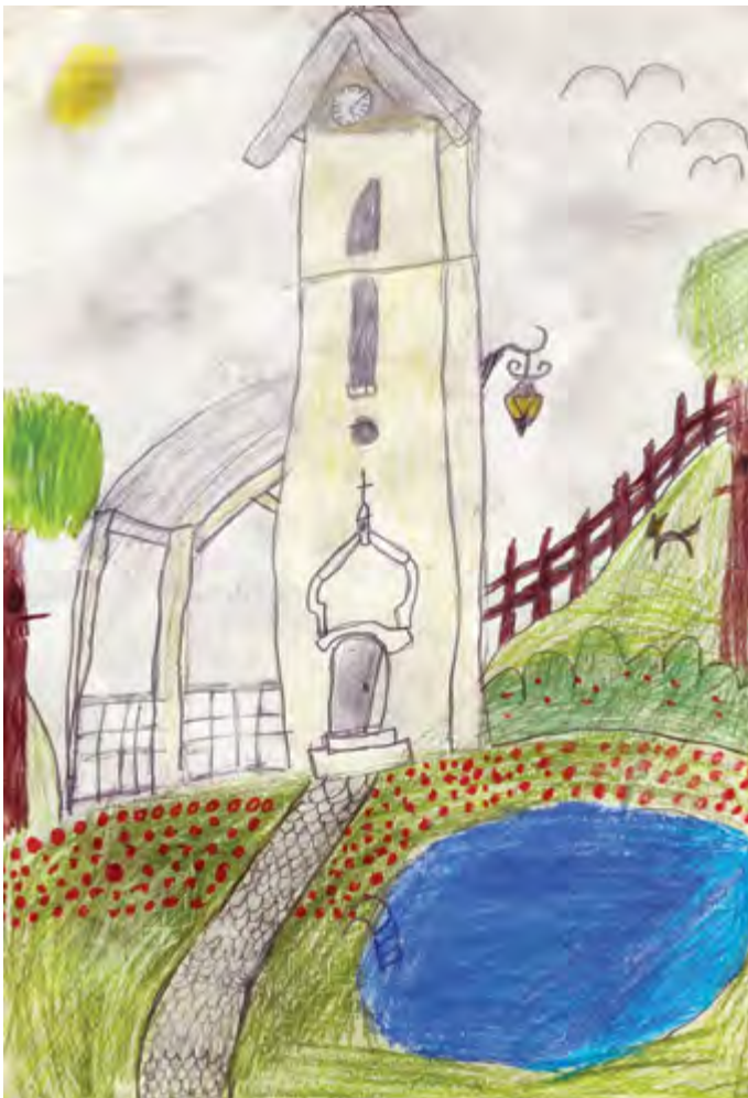
I. hely – Jelige: ELER22, 9 éves

A Budakalászi Hírmondó májusi számában, „Álmaim Kalásza” címmel meghirdetett gyereknapú rajzpályázatunkra olyan rajzokat, festményeket és alkotásokat vártunk, amelyek a helyi gyerekek mostani kedvenc kalászi helyeit ábrázolják, vagy olyasmint, ami még nincs Kalászon, de nagyon örünének neki, ha lenne. A beküldési határidő június 10.-e volt, ezt követően a munkákat szakmai zsűri értékelt. Köszönjük minden résztvevőnek a részvételt, a pályamunkák beküldését! Cikkünkben a nyertes pályamunkákat mutatjuk be, de a beküldött rajzokból kiállítás is készül a Faluházban az ősz folyamán.