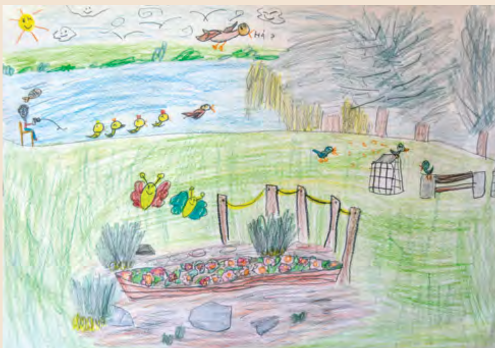
II.hely – Jelige: 201306, 8 éves