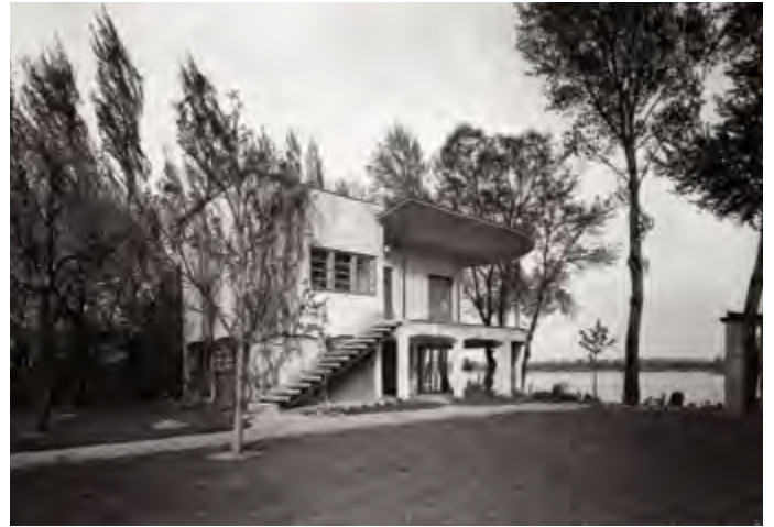
Kozma Lajos nyaralója - Fortepan, 1941