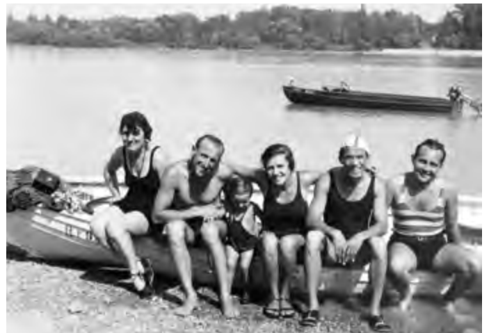
Csoportkép 1936-ból

ez a ház, hanem Kozma Lajos építész saját maga számára készített üdülője adott inspirációt a többi szigetlakónak villája tervezésekor. A Platán sor 8. alatti vasbeton nyaraló a magyar modern építészet egyik szimbóluma lett. Mivel a sziget csak hajóval közelíthető meg, az építkezés itt költséges, racionalizált és minimalista. Ez találkozott a korszak haladó építészeti irányelveivel, a Bauhaus emberléptékű, funkcionalista törekvéseivel. A sziget másik adottsága, hogy folyamatosan ki van téve a Duna áradásainak, ez magyarázza a lábakon álló, lapos tetős villák sorát. Kozma több üdülőt tervezett a szigeten, de mellette a korszak jelentősebb modernista építészei, Forbát Alfréd vagy Körner József is terveztek nyaralót a szigetre.