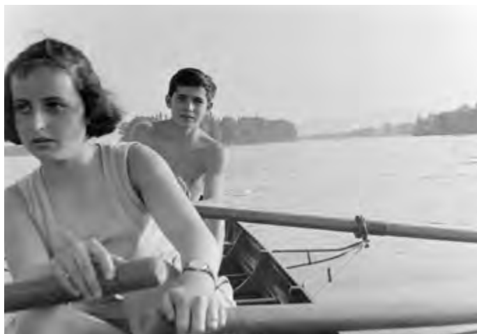
Fortepan 4868, 1956

A Helvétia Rt. egy mintaházat is építtetett, bízva abban, hogy majd több megbízást is kap nyaraló építésére, azonban mégsem