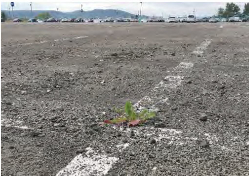
Vízbázis védőterületen meg kell akadályozni a szennyeződések talajba jutását

Ezért aztán szigorú szabályok vonatkoznak a védőterületekre. Öt évvel ezelőtt a Lupa Strand vízbázis tetején épült óriásparkolójának szabályszerűségével kapcsolatos aggályok is ezért kerültek napirendre. Az autókról származó olaj- és nehézfém-szarmazékokat úgy lehet távol tartani a vízáadó rétegtől, ha a parkoló felszínén vízzáró felülettel akadályozzák meg a szennyeződések talajba szivárgását, a szennyezett csapadékvizeket pedig összegyűjtik megszűrjük és elvezetjük. A parkolót laza szerkezetű márt aszfalttal borították, ezért a szükséges vízzárásról, a fontos műszaki és eljárásjogi kérdések megnyugtató megválaszolása érdekében jelenleg is jogi eljárások folynak. A legfontosabb tisztázandó kérdés, hogy a 2019-ben engedély nélkül így megépült parkoló felülete az utólag megadott fennmaradási engedély ellenére vízzárónak tekinthető-e?