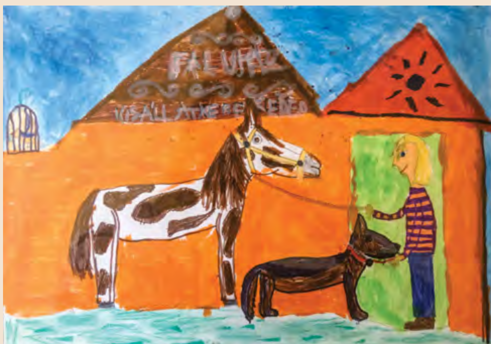
III.hely – Jelige: Állatszeretetet, 10 éves