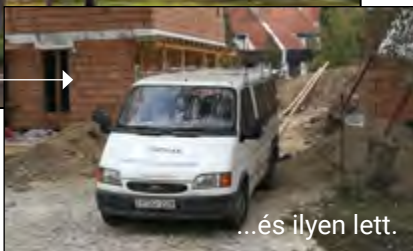
...és ilyen lett.

A településrendezési eszközök felülvizsgálata tavasszal elindult. A felülvizsgálat Budakalász teljes közigazgatási területére kiterjed és végső célja a Helyi Építési Szabályzat (HÉSZ) módosítása. Amíg ez elkészül – de legfeljebb három évig – változtatási tilalom rendelhető el. A változtatási tilalom alá eső területen főszabályként telket alakítani, új építményt létesíteni, meglévő építményt átalakítani, bővíteni, továbbá elbontani, illetőleg más, építésügyi hatósági engedélyhez nem kötött értéknövelő változtatást végrehajtani nem szabad.