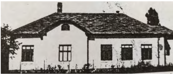
A szentistvántelepi iskola első épülete

A Szentistvántelepi Általános Iskola a Klebersberg Kunó-féle népiskola építési programnak köszönheti a létét. 1926-ban hozták létre az országos Népiskolai Építési Alapot, amelyből három év alatt ötezer falusi, tanyai tanterem épült Magyarországon. A húszas évek elején annyi gyermek költözött az Akarat Szövetkezet által felparcellázott telkekre – amit 1925. augusztus 20-i felszentelésétől kezdve Szent István telepnek neveztek –, hogy szükségessé vált számukra egy önálló iskola.