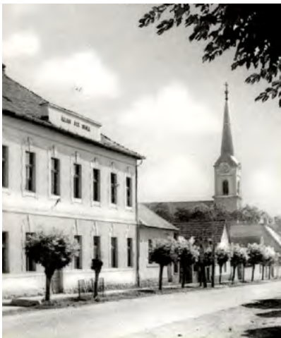
A Budakalászi Állami Elemi Népiskola

Bár az általános tan kötelezettséget a Magyar Királyságban már Eötvös József minisztersége idején 1868-ban törvényben írták elő, még évtizedekig váratott magára a népoktatás elterjedése az iskolák hiánya miatt. Budakalászon például a századfordulón 304 tanköteles gyermek közül csak 124 járt iskolába. A pomázi járásban élő lakosság többsége nem beszélt magyarul, az 1900-