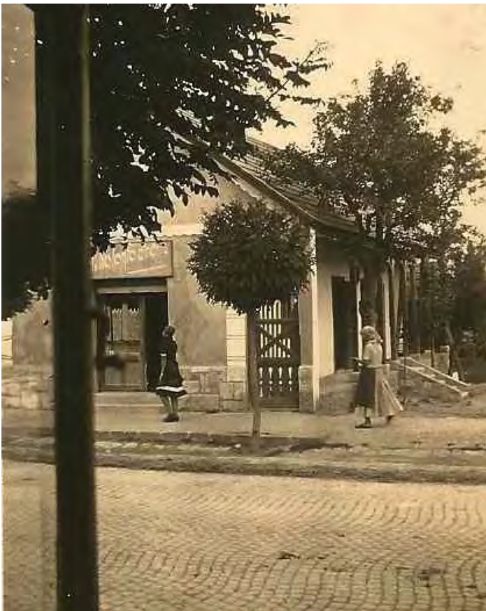
A fotó az 1940-es években készült az akkor még Bajcsy Zsilinszky út 12-ről

A parasztház, amiben most a Régimódi Szatócsbolt helyezkedik el, közel 100 éve épült fel Básiy Ignác és Milka néni otthonaként. A ház utcafronti részén Básiy Ignác fodrászüzlete működött.