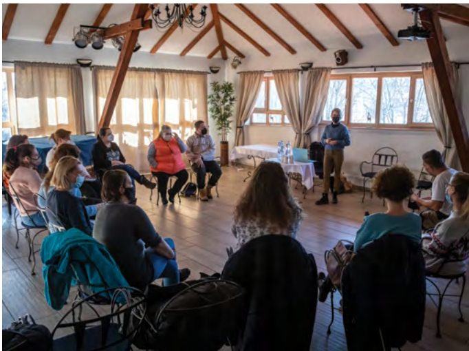
Egy atipikus találkozás