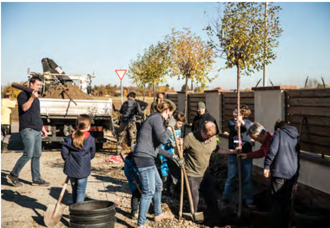
Ősszel 141 fát ültettünk el közösen

Az Élhető Budakalász program koncepcionális szakasza zárult le, több lakossági, civil, nemzetiségi, egyházi és vállalkozói egyeztető fórumon vagyunk túl. A járvány ellenére nagyon sok információt sikerült begyűjteni a kalásziaktól, a civil szervezetektől. Örülök, hogy többszáz budakalászi töltötte ki azt a lakossági kérdőívet, ami nagyon fontos megerősítő információkat tartalmaz számunkra arról, hogy jó úton járunk.