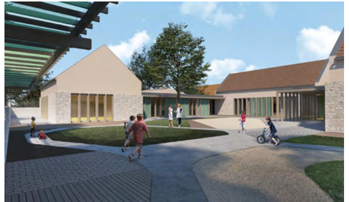
A Vasút soron új óvoda épül a budakalászi gyerekeknek

Január elején érkezett a hír, hogy kiírták a kivitelezői tendert. Ez azt jelenti, hogy nagyjából az év közepére – ha a Nemzeti Infrastruktúra Fejlesztő Zrt.-nél is minden a tervek szerint alakul – lehet már szerződés a kivitelezésre. A megépítése több éves folyamat lesz, hiszen a projekt tartalmazza a 11-es út bővítését Budakalász és Szentendre között. Az elkerülő azért fontos, mert tehermentesítheti Budakalász belső útjait, főleg a Lenfonó csomópont környékét és a József Attila utcát, de a környező utcákat is.