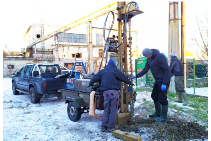
Vizsgálatot indítottunk a Lenfonó környezetszennyezésének kivizsgálására

Környezetvédelmi intézkedéseink legfontosabbja a Lenfonó területén feltárt szennyeződés és a teljes gyárterület rehabilitációjának elindítása volt. A súlyos szennyeződés a gyár állami