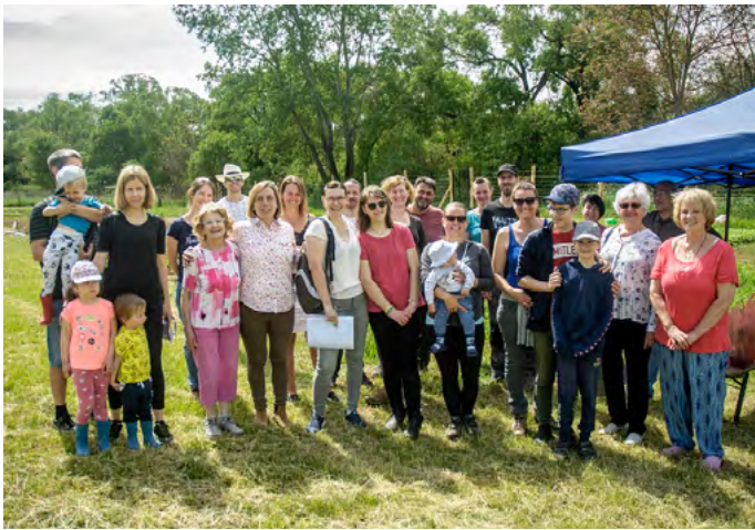
Közös hobbi, közös programok, közösségi kert a Klislovác utcában

Ugyanígy szólni kell a Közösségi Kertről is . A Kislovác utcában a patak mellett, önkormányzati területen jött létre a Közösségi Kert azok számára, akiknek otthon nincs megfelelő helyük arra, hogy zöltséget, gyümölcsöt termesszenek. Különleges dolognak tartom, hogy a profi kertészeket és az abszolút kezdő, lelkes amatőröket ilyen hamar közösségé formálta. Élmény arra járni, látni, hogy milyen szépen be van ültetve a terület. Az önkormányzat körbekerítette és megoldotta az öntözést, de a legnagyobb értéket a budakalászi tagok lelkes munkája, közös célja jelenti.