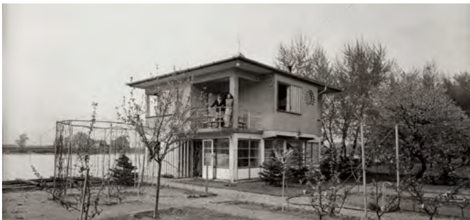
Nyaraló, 1941.

A múlt század húszas éveiben fellendülő turista- és vikendmozgalomhoz köthető, hogy a Dunát ellepték az evezősök. A Helvétia Építő és Ingatlan Rt. meglátta ebben a lehetőséget, megvette az örökösöktől a Luppa-szigetet, és éppen kilencven évvel ezelőtt, 1932-ben nyeles telkekre osztották fel a területet, így néhány belső telek kivételével minden nyaralónak volt saját Duna-partja vagy lejárata a Dunához. Folyami kövel megerősítették a hordalékszigetet, kiépítették a villany-, víz- és csatornahálózatát, és a telkeket újsághirdetésekből kínálták elsősorban a tehetős budapestieknek. A nyaralóhely híre hamar elterjedt, és a szigetet néhány év alatt birtokukba vették az üdülők. Az első modern vikendházat