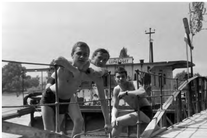
Hajóállomás, 1964.

Soros Tivadar ügyvéd építtette Farkas Endre és György tervei alapján 1934-ben. A sziget korai lakói között volt Kozma Lajos építész, aki saját maga számára tervezett üdülője később több szigetlakó villájának tervezéséhez is inspirációt adott, és máig meghatározza a sziget különleges hangulatát. A Platán sor 8. alatti vasbeton nyaraló a magyar modern építészet egyik szimbóluma lett. Mivel a sziget folyamatosan ki van téve a Duna áradásainak, a nyaralók többsége vasbeton lábakon áll, lapos tetős, praktikus elrendezésű, minimalista épület. A sziget csak hajóval közelíthető meg, az építkezés itt költséges, és csak a legszükségesebb alapanyagokra szorítkozhat. Ez találkozott a Bauhaus emberléptékű és funkcionista törekvéseivel. Kozma több üdülőt tervezett a szigeten, melyek közül egy ma műemlék, de mellette a korszak jelentősebb modernista építészei, Forbát Alfréd vagy Körner József is terveztek itt házat. A parcellázással egy időben ültették a ma már védett platánsort, ami a felgallyazás és a sűrűn ültetés miatt különbözik a városokban általában megszokottól: a fák törzse