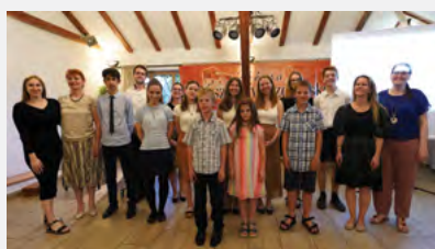
A Zongora Gála néhány szereplője

Jubileumi Jótékonyági Zongora Gálát rendeztünk június 2-án öt zongoratanárunk 23 tehetséges és versenygyőztes növendékének fellépésével, 25 éves, országos hírű zongora tanszakunk megünneplésére. A kétrészes koncerten a csodálatos élő műsorszámok mellett – H. Kürtösi Mónika kollégánk munkájának köszönhetően – összefoglalva hallhattuk a tanszak történetét, valamint videó bejátszással velünk voltak korábbi versenygyőzteseink és kivetített fotókon korábbi növendékek és szülők is. A 155 ezer forint adományt egy hangversenyzongora beszerzésére szeretnénk fordítani.