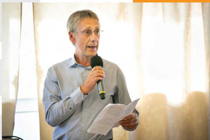
dr. Göbl Richárd polgármester

A demencián, ezen az óriási és egyre több embert érintő terhen kívánt enyhíteni Budakalász vezetése, mint ahogyan azt az orvos-polgármester, dr. Göbl Richárd megfogalmazta: a 2011 Egyesület a választási ígéretében megfogalmazottak szerint nem csak a város vagyonát kívánja megvédeni, hanem az Alzheimer caféval például a budakalásziak pszichoszociális értékeit is. Dr. Göbl Richárd egyből egy betege történetével kezdte az előadását, aki feledékenysége miatt először tévedésből belgyógyászatra került, majd az ő szakrendelésére, és ott derült ki, hogy valójában egy agydaganat okozta a tüneteket. A beteget megműtötték, felépült és később még a jogosítványát is visszakapta. Az Alzheimer caféban résztvevők első lépése tehát az önmaguk vagy a hozzátartozójuk szakorvoshoz küldése és a pontos diagnózis megállapítása. A demencia közel 70%-át okozza Alzheimer kór, de számos más ok is lehet.