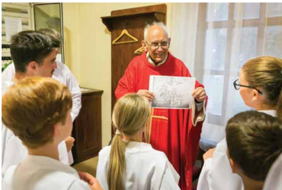
Soma atya ismét a kalászi gyerekek körében 2021 szeptemberében