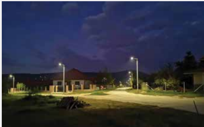
A közvilágítás korszerűsítésének elindítása is szerepel a költségvetésben.

A takarékos gazdálkodás mellett elsősorban a sikeres pályázatoknak köszönhető, hogy idén 801 millió forint jut beruházásokra és felújításokra, Budakalász fejlesztésére. Tavaly különböző pályáza-