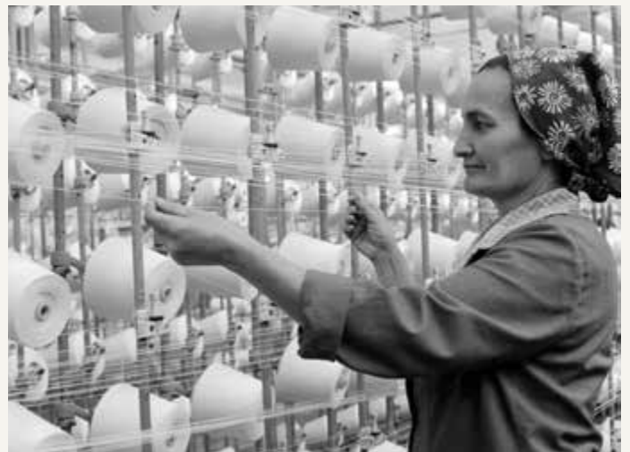
Egy munkásnő a Textima felvetőgépeken készíti elő a lánchengert

hetetlenné vált. A dolgozók nem tudták, hogy milyen összegek ellenében és hová kerül a textilgyár vagyona, utólag készpénzes kifizetések hírei is szárnyra keltek. Szerencsére volt, ami megmenekült az enyészet elől, az értékesebb árukat magánkisiparosok kezdték gyártani, így a filmnyomás kiszerveződött a gyárból.