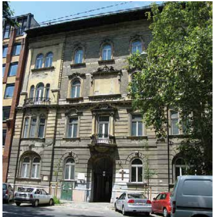
Damjanich utca 50.

Kevés egyházi középiskola működhetett a rendszerváltást megelőzően, de Szentendrén és Esztergomban egyaránt találunk ferences gimnáziumokat - ezek az iskolák elitintézmények voltak akkor is és az a kalászi elit, akik például a szentendrei