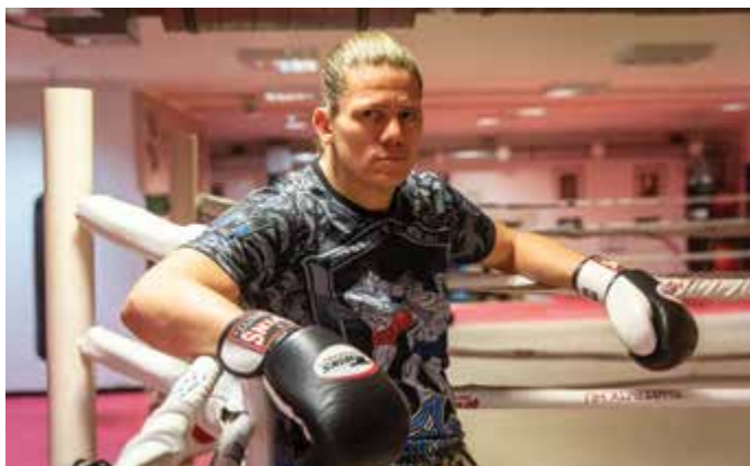
További információk az egyesületről a www.bekesharcos.hu weboldalon.

Térjünk vissza a sikerhez. Ha van egy bejárt nyomvonalad, ami a sikerhez szokott vezetni, akkor beépül az emberbe a gyakorlattal járó önbizalom. Ha kívülről kap az ember egy sebet, akkor a sport mellett, hogy segít kiadni a feszültséget, tapasztalatot ad a sikerben, ami a mindennapi elakadásokon is átlendít.