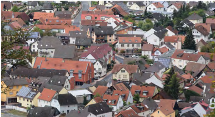
Kahl am Main

Az elmúlt évtizedekben Budakalász három európai településsel létesített testvérvárosi kapcsolatot. Németországban Kahl am Main városával, a nemzeti összetartozás jeleként pedig Erdélyben Lövéttel és a Délvidéken Adával. A német településsel idén 25 éves az együttműködés. A remények szerint az előttünk álló időszakban új lendületet kapnak a testvérvárosi kapcsolatok.