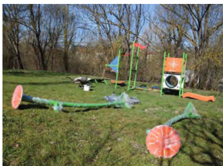
A játszótér és a fészekhinta közvetlenül a patak mellé kerül

A Barát-patak torkolatnál készülő zsilip kivitelezőjével folytatott tárgyalások eredményeként az Aqua-General Kft. vállalta, hogy az Önkormányzattal együttműködve szerepet vállal egy budakalászi játszótér felújításában, kibővítésében. A következő napokban így kerül majd