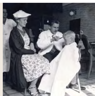
Kép: Fodrászat, Budapest, 1936.