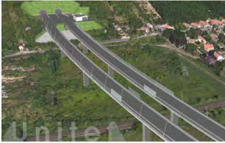
Budakalász és Óbuda határában viadukton érkezne az alagutakhoz az M0 autópálya. De mikor?