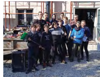
A Cserkészház környékén takarító csapat

Mindenkinek köszönjük, aki részt vett Budakalász takarításában!