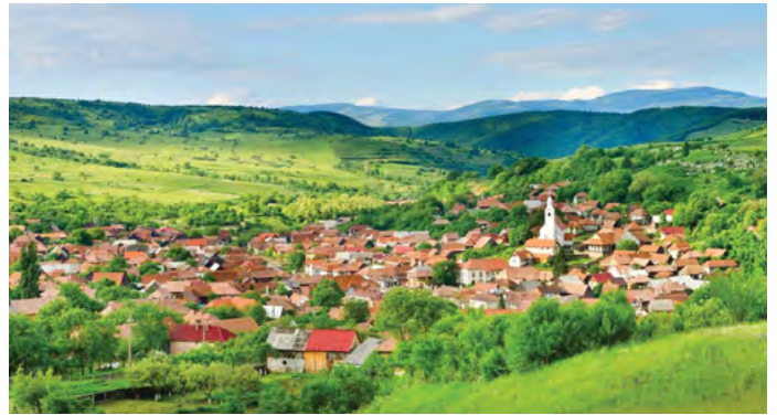
Lövéte látképe

Budakalász korábbi polgármestere. Budakalász Város Önkormányzata a Hargita megyei Lövéte településsel 2000-ben kötött testvérvárosi megállapodást a nemzeti összetartozás jegyében. A Székelyudvarhelytől 30 kilométerre fekvő 3500 lakosú székely-magyar település mellett 2009-től a délvidéki (kelet-bácskai) többségében még magyarok lakta Ada településsel is testvérvárosi kapcsolatban vagyunk. Délvidéken az etnikai és az országhatárok már lassan összeérnek, Erdélyben is egyre kevesebb magyar szót hallani. Ezért is volt fontos és szimbolikus jelentőségű, hogy a Budakalász a délvidéki Ada és a székelyföldi Lövéte településekkel is testvérvárosi kapcsolatot kötött.