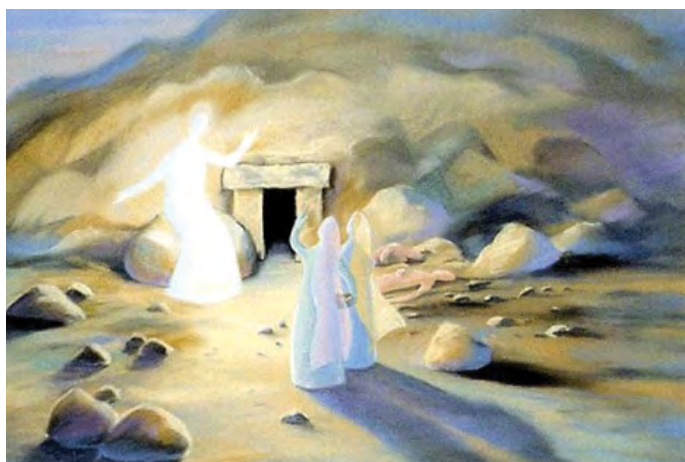
Ain Vares: Krisztus feltámadt!

a fájdalom örömmé, a vég kezdetté, a halál pedig életté változik. Innen kapjuk azt az erőt, amely elegendő ahhoz, hogy a keresztet elbírhassuk a vállunkon. Ne hagyjuk, hogy a modern világ hatására a húsvét Krisztus nélkülivé, pusztán csak locsolgató, nyusziszonkás-csokitojós tavaszi ünneppé váljon, mert akkor éppen a lényegtől, Krisztus üzenetétől fosztjuk meg magunkat. Ez az örök krisztusi üzenet pedig nem más: az Élet győzött a halál felett. Az Igazságot meg lehet ölni, de elpusztítani nem lehet. Harmadnapon diadalmasan feltámadt. Áldott Húsvéti Ünnepet Mindenkinek!