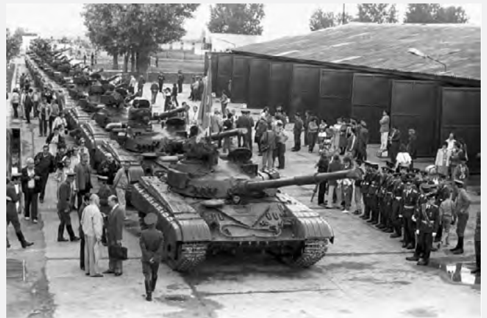
1991. június 19-én az utolsó megszálló szovjet katona is elhagyta Magyarországot. A díszszemlére is a szentendrei vízbázis mellett készítették fel a tankokat.