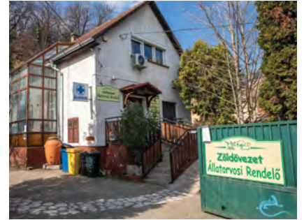
Budai út 103.

TNR, trap-neuter-return módszernek hívják a nemzetközi szakirodalomban, Amerikától Európán át hasonló eljárással végzik a kóbor állatok ivartalanítását. A már ivartalanított macskák bal fülének hegyéből egy darabkát lemetszünk, ezzel jelezve, hogy az állatot már nem kell befogni. Ezek a cicák általában nem annyira szelídek, a harapásuk veszélyes, ha dobozba akarjuk rakni őket, ellenállnak, így ezeket a helyzeteket el kell kerülni. A csapdákat először nem beélesítve rakjuk ki, tehát csak bemegy a macska, eszik és kijön. Amikor már megszokja, akkor élesítjük a csapdát és a cica egy pedálra lépve magára csukja a dobozt. Ezután aki befogta az állatot, egyeztetett időpontra elhozza a rendelőbe. Megfelelő eszközökkel az altató injekciót be tudjuk úgy adni, hogy a cica senkit se harapjon meg. Ivartalanítás után az állatokat vissza lehet engedni a megszo-