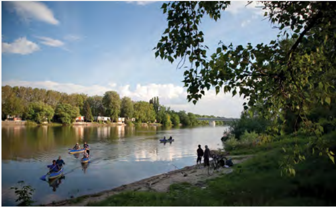
Fontos állomáshoz érkezett a Duna-parti fejlesztés.

Az Önkormányzat szorgalmazza az eddig ellátatlan vagy korszerűtlen vezetékes internetes technológiával ellátott városrészek internet-korszerűsítését. A napokban fontos állomáshoz érkezett a Duna-parti fejlesztés.