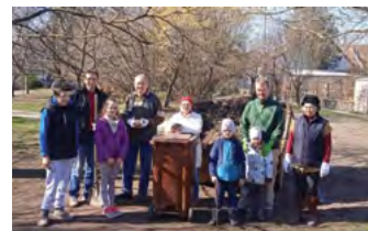
A Holló-völgyi és a Szentistvánteplei csapat