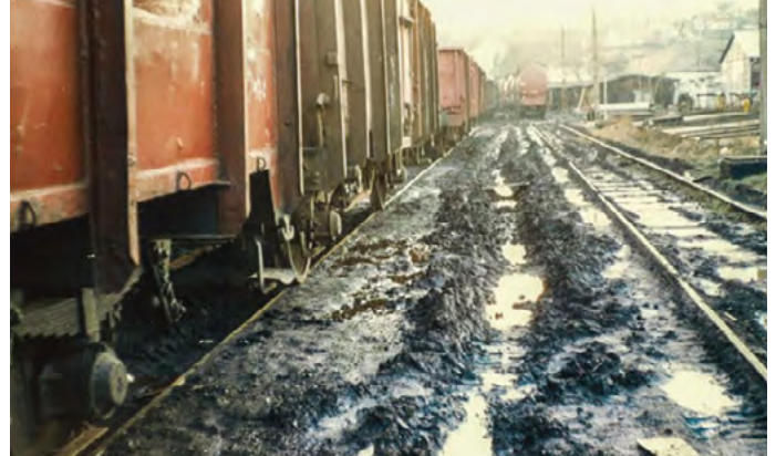
A pakurát gőz- és melegvíz-termelésre használták. A vasúti tartálykocsikon eltérő leeresztő csatlakozások voltak, de a telepen csak egyfajta, így a lefejtéskor sokszor jó része mellé folyt. Folyamatosan állt az olajsár.

Saját vizsgálatunk az egyik mintavételi ponton jelentős egészségügyi kockázatú vegyületeket mutatott. Magas volt az arzén, króm, réz és a cink szennyeződés, a kőolajszármazékokra utaló toxikus anyagok jelenléte pedig a határérték sokszorososa. 2021 februárjában tájékoztattuk a Környezetvédelmi Hatóságot és a Fővárosi Katasztrófavédelmi Igazgatóság illetékeseit a lesújtó eredményekről, és kértük a szükséges hatósági vizsgálatok mielőbbi