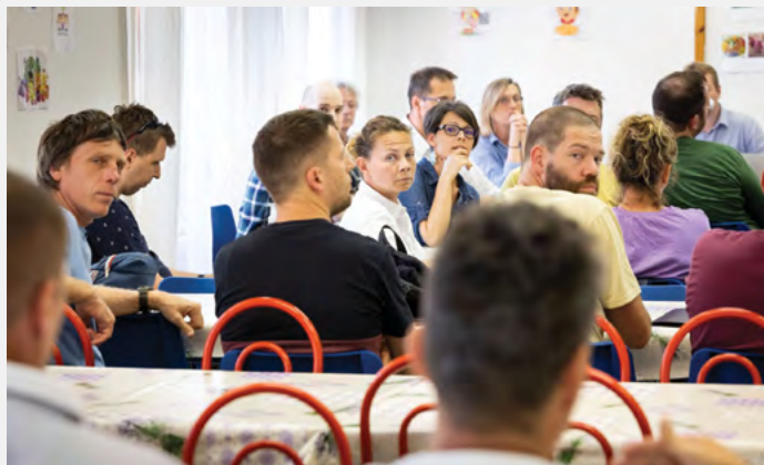
A Berdó lakói aktívan részt vettek a lakóhelyüket érintő kérdések megvitatásában

A szomszédos ingatlanok tulajdonosai azonban úgy érveltek, hogy a tervezett fejlesztés zavarná a privát szférájukat, ezért vételi ajánlatot terveznek tenni az keskeny önkormányzati telekre. A képviselők ennek ismeretében fognak dönteni, a tervezett gyalogos átkötés és a gyümölcsös sorsáról.