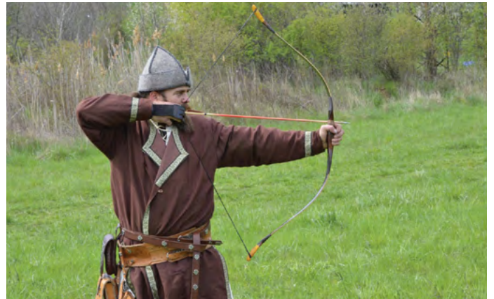
Kép az íjászpálya galériájából

Ki van állítva egy makett is egy jurtával, ami mellett fel vannak sorakoztatva az ősi mesterségek. Manapság kihalófélben vannak ezek a csodálatos régi szakmák. Ön át tudja örökíteni valakinek ezt a tudást?