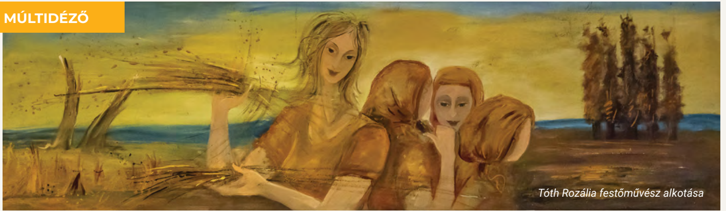
Tóth Rozália festőművész alkotása