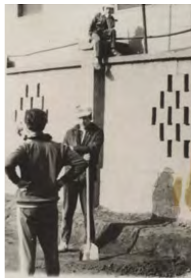
Társadalmi munkában készült a pálya

Három pálya volt, de nem a mostani helyén, a Faluház mellett, hanem a magánóvoda helyén, ami egykor a gyár óvodája és bölcsődéje volt, valamikor az 50-es években építették. Nagybátyámnak, aki akkor már részlegvezető volt, elévülhetetlen érdemei vannak abban, hogy a pályák mai helyén egyből négy új pályát építettek. Azt is hozzá kell tenni, hogy abban az időben ezek a pályák szinte semmibe sem kerültek. Az 50-es években szénnel fűtöttek a gyárban, korlátlanul képződött a salak, teljesen ingyen fél méter salakréteg jutott a pályák alá, így a mai napig minden vizet felszívna, a legnagyobb esőzések után is lehet rajtuk játszani. A tetejére kellett egy kis agyag, a felső salakréteg, az úgynevezett vörössalak a békásmegyeri téglagyárból származó téglaporból készült, amit itt rostáltak át. A kalásziak mindezt társadalmi munkában hozták létre.