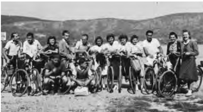
1941: biciklivel Visegrádra

A teniszkлубból soha senki sem vitt haza pénzt, a teniszezők csak befizettek és dolgoztak. Ez ma is egy sok társadalmi munkát végző, összetartó közösség.