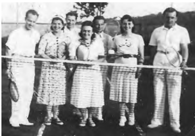
A Klinger gyár tenispályáján 1940-ben