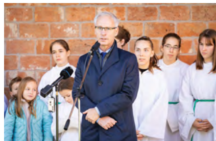
Soltész Miklós államtitkár

Az ünnepi délelőttön több aprócska és ifjú ministráns kísérte Zoltán atyát az ünnepi mise celebrálására, majd a közösség együtt vonult ki a templomkertbe, hogy Budakalászi plébánosa megáldja a megújult templomot. A templom megáldását megelőzően először dr. Göbl Richárd polgármester mondott beszédet, melyben kifejtette, hogy a világra egyre jobban jellemző szekularizáció ellenére Budakalászi templomot újít és a közössége keresztény szellemiségben épül. A polgármesteri beszédet követően Soltész Miklós, a Miniszterelnökség egyházi és nemzetiségi kapcsolatokat felelős államtitkára adott hangot az örömeinek a misén részt vevő gyermekek jelentős száma miatt, ami annak a biztosítéka, hogy a jövőben is telt házú misékre számíthat a város. Miután Zoltán atya megáldotta a templomot, a hívek szeretetvendégségre invitálták a jelenlevőket.