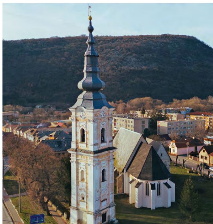
Pelsőc református temploma

A templomban viszonylag ritkán vagyunk, egy héten (vagy egy hónapban vagy egy évben vagy egy nap) csak egyszer. A templom