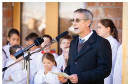
dr. Göbl Richárd polgármester

A templom felújítása összesen 39 millió forintba került, amiből 33,5 millió forintot pályázati úton nyert el a város erre a célra a Bethlen Gábor-alapítól, 5,5 millió forintot pedig a Plébánia biztosított a beszerzési eljárás eredményessége érdekében az Önkormányzat számára. A felújítás során sor került az új előtető építésére, a nyílászárók árnyékolására, a lámpatestek cseréjére, a homlokzat felújítására, ezen belül a homlokzati köféléletek, korlátok javítására és felújítására is.