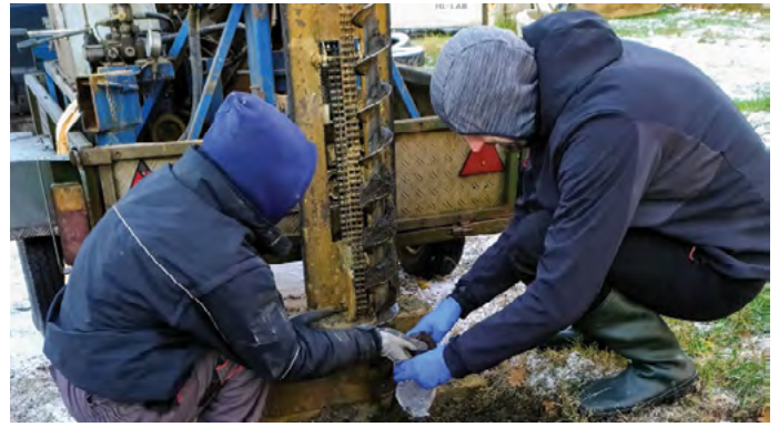
A 2011 Egyesület kezdeményezésére 2021 januárjában kezdődtek a mintavételek.

A Környezetvédelmi Hatóság ezután a tulajdonos Budakalász Város felelősségét tisztázta. Mivel a városvezetés egyértelművé tette, hogy a gyár működése a nyolcvanas években megszűnt, Budakalász pedig csak 1996-tól tulajdonosa a gyárterületnek. A város pedig nem folytat és sohasem folytatott ipari tevékenységet az egykori szövőgyár területén.