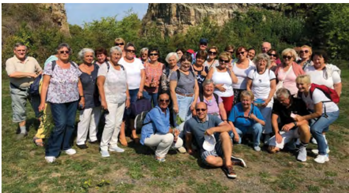
Kemenes Vulkanpark, Ság hegy.