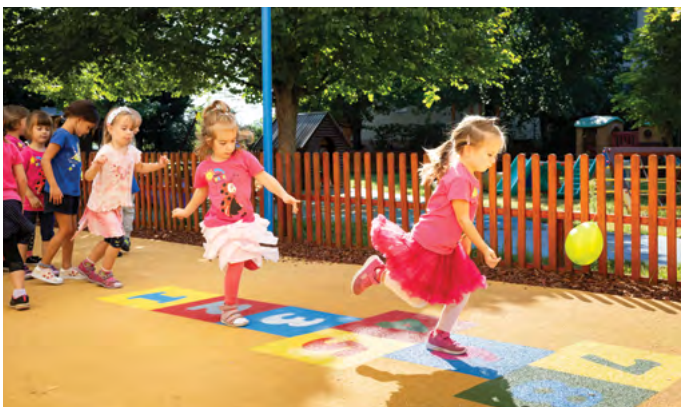
2023-ban a Telepi Óvoda udvara is megújult.

Míg 2023-ban 157,9 millió forintot kellett szolidaritási adóként befizetnünk a központi költségvetésbe, idén már 215 millió forintot kell. A teher nagyságát jól mutatja, hogy ez a fejlesztésekre fordítható teljes éves városi büdzsének megfelelő összeg.