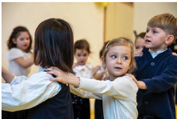
A Napsugár csoport óvodásai január 8-án költöztek be új otthonukba és rövid idő alatt megbarátkoztak az új helyvel.

A térség országgyűlési képviselője, dr. Vitályos Eszter miniszterhelyettes a béke, a szabadság és az egyetértés fontosságáról beszélt. Köszöntőjében elmondta: 2010 óta az óvodai férőhelyek száma 18 ezerrel emelkedett hazánkban, erre a célra 320 milliárd forintot fordított a kormány.