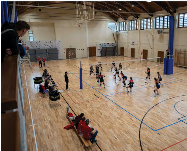
A karzatról jelentős szurkolás segítette a hazai csapatot