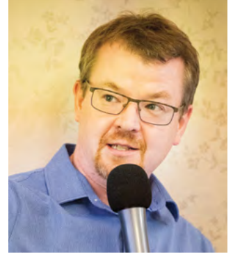
Nagel István alpolgármester

A 2011 Egyesület képviselőivel és a Településfejlesztési Bizottsággal közösen jelenleg az időkorlátos parkolás bevezetésében látjuk az érintett belvárosi területen jelentkező gondok megoldását.